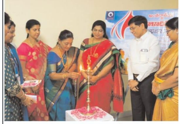
విశాలవిశాఖ (పరవాద్) :